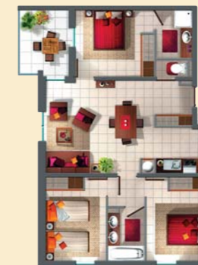
Par exemple, VOTRE 4 PIÈCES lot n° 27