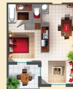
Par exemple, VOTRE 2 PIÈCES lot n° 29